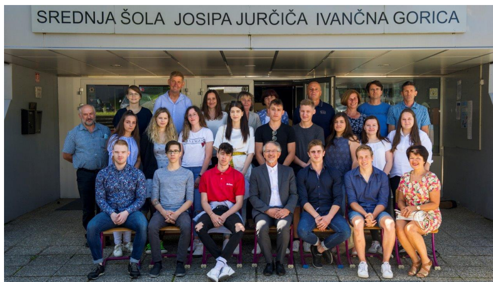
Slika 2: Pred podelitvijo spričeval PM