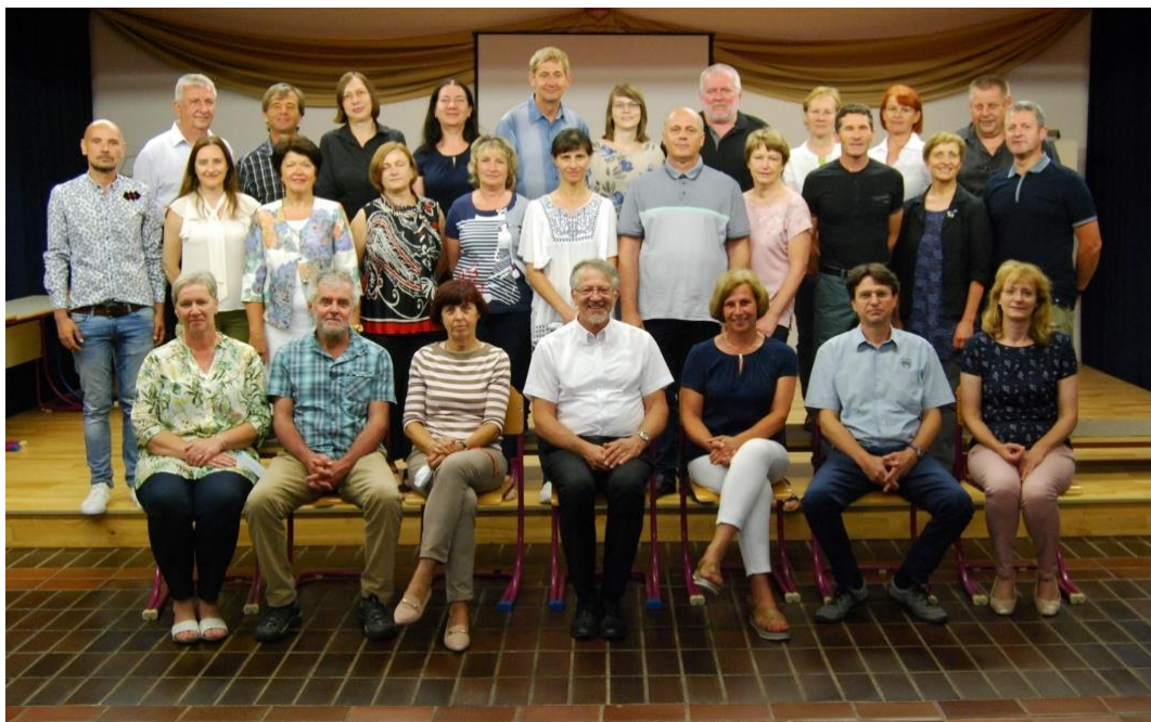
Slika 1: Del kolektiva Srednje šole Josipa Jurčiča Ivančna Gorica ob koncu pouka 2019/2020

Svet zavoda je nastopil mandat 18. aprila 2017 in traja po veljavnih predpisih do 17. aprila 2021.