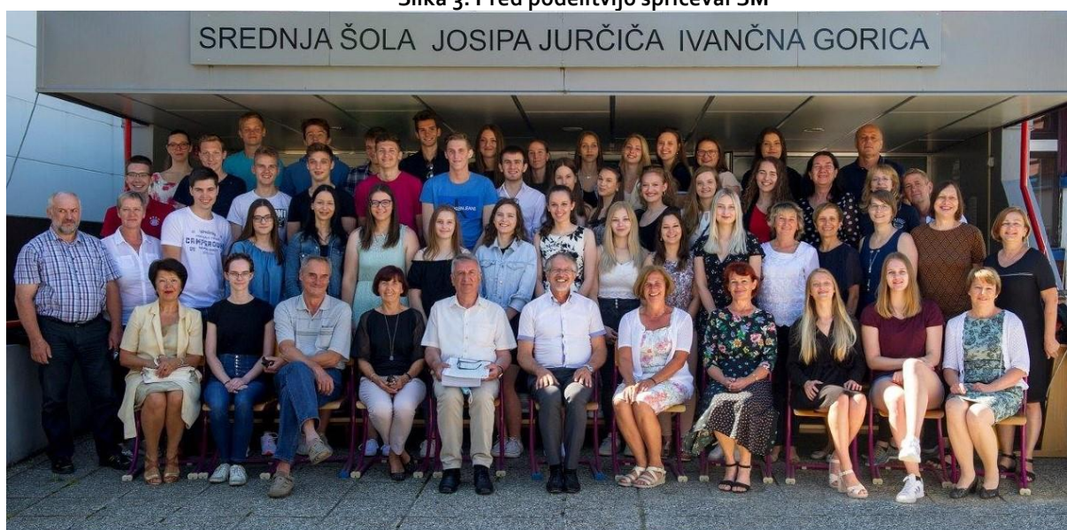
Slika 3: Pred podelitvijo spričeval SM

Od 38 dijakov programa gimnazija, ki so opravljali splošno matura, je bilo v spomladanskem roku uspešnih vseh 38 kandidatov ali 100 %.