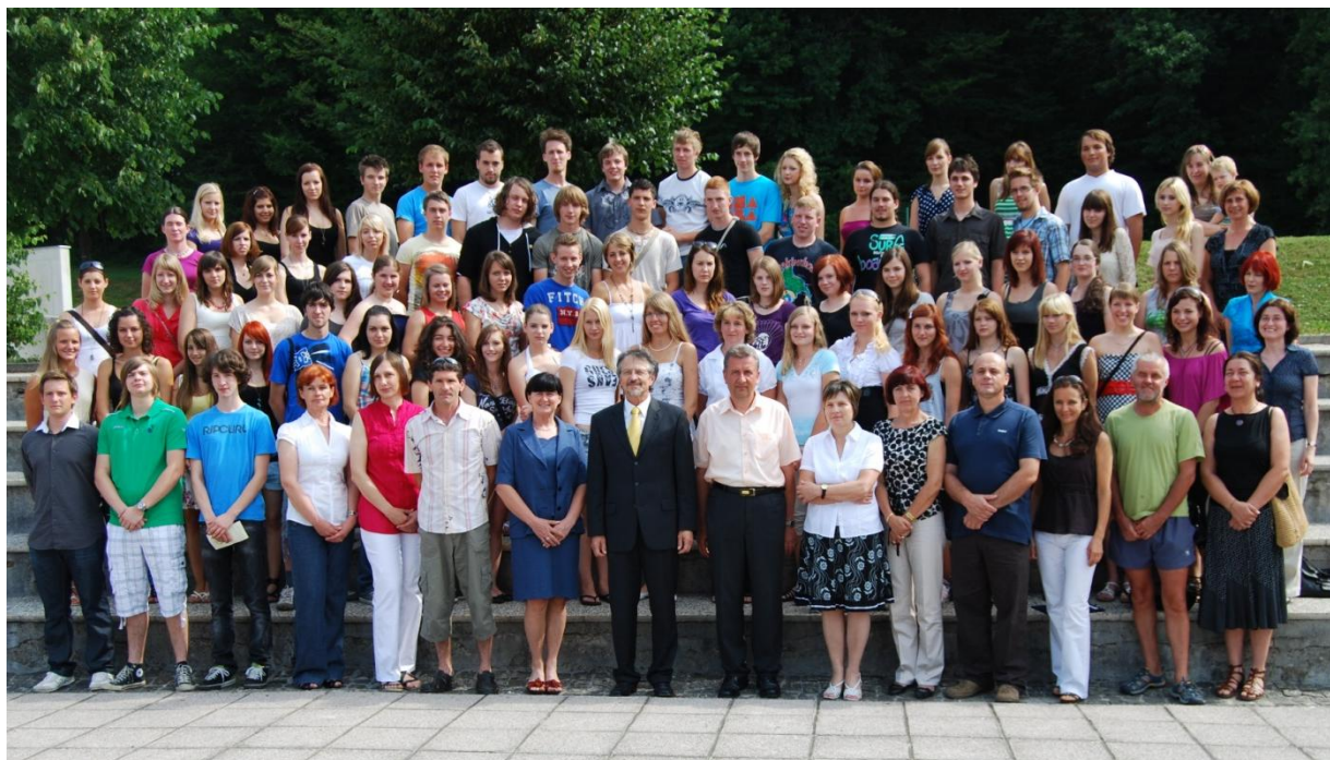
Preglednica 10: Uspeh v spomladanskem roku 2011 po oddelkih in programih