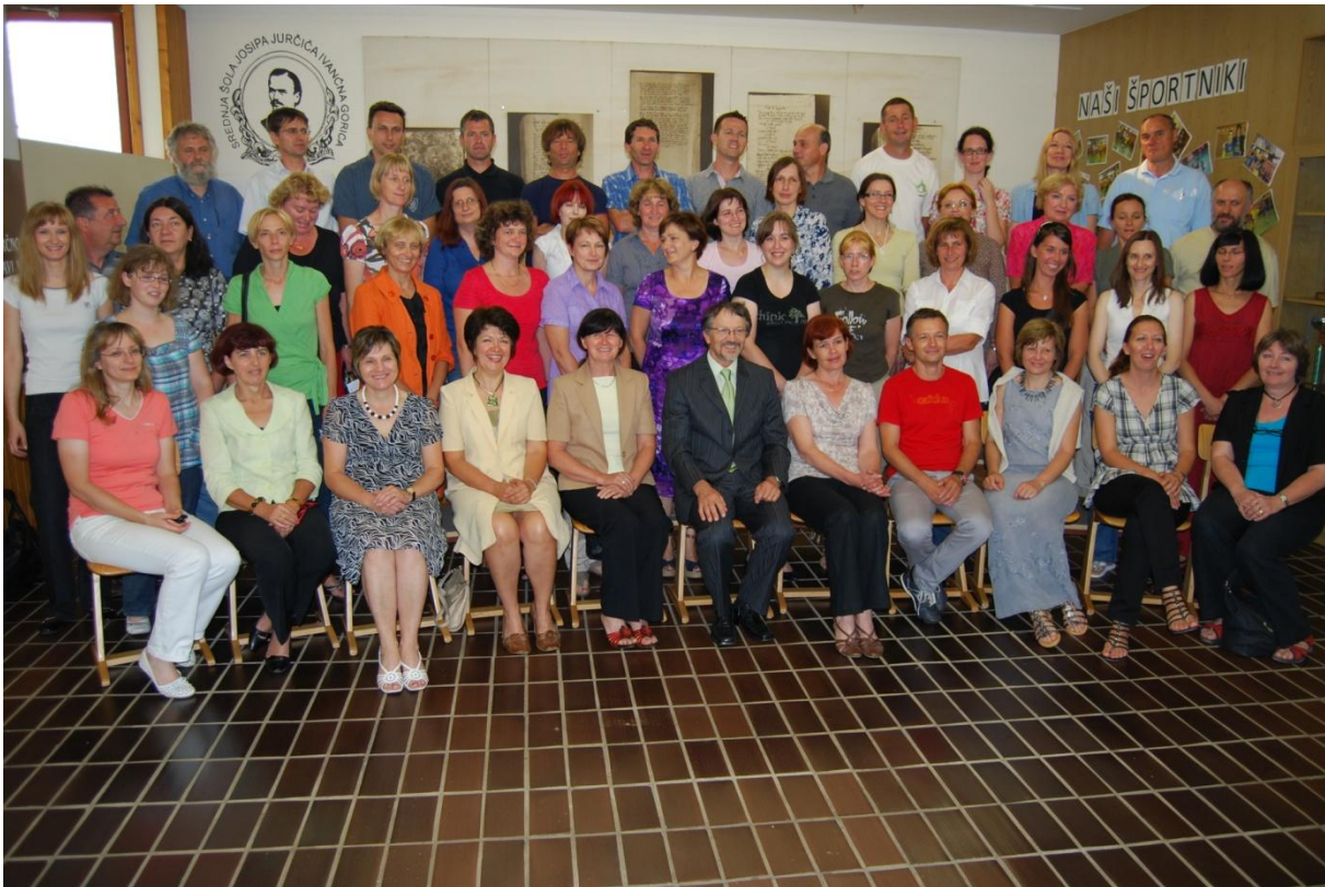
Slika 1: Učiteljski zbor ob koncu pouka 2010/2011

Svet šole, ki je 7. 4. 2009 začel svoj mandat, sestavljajo: