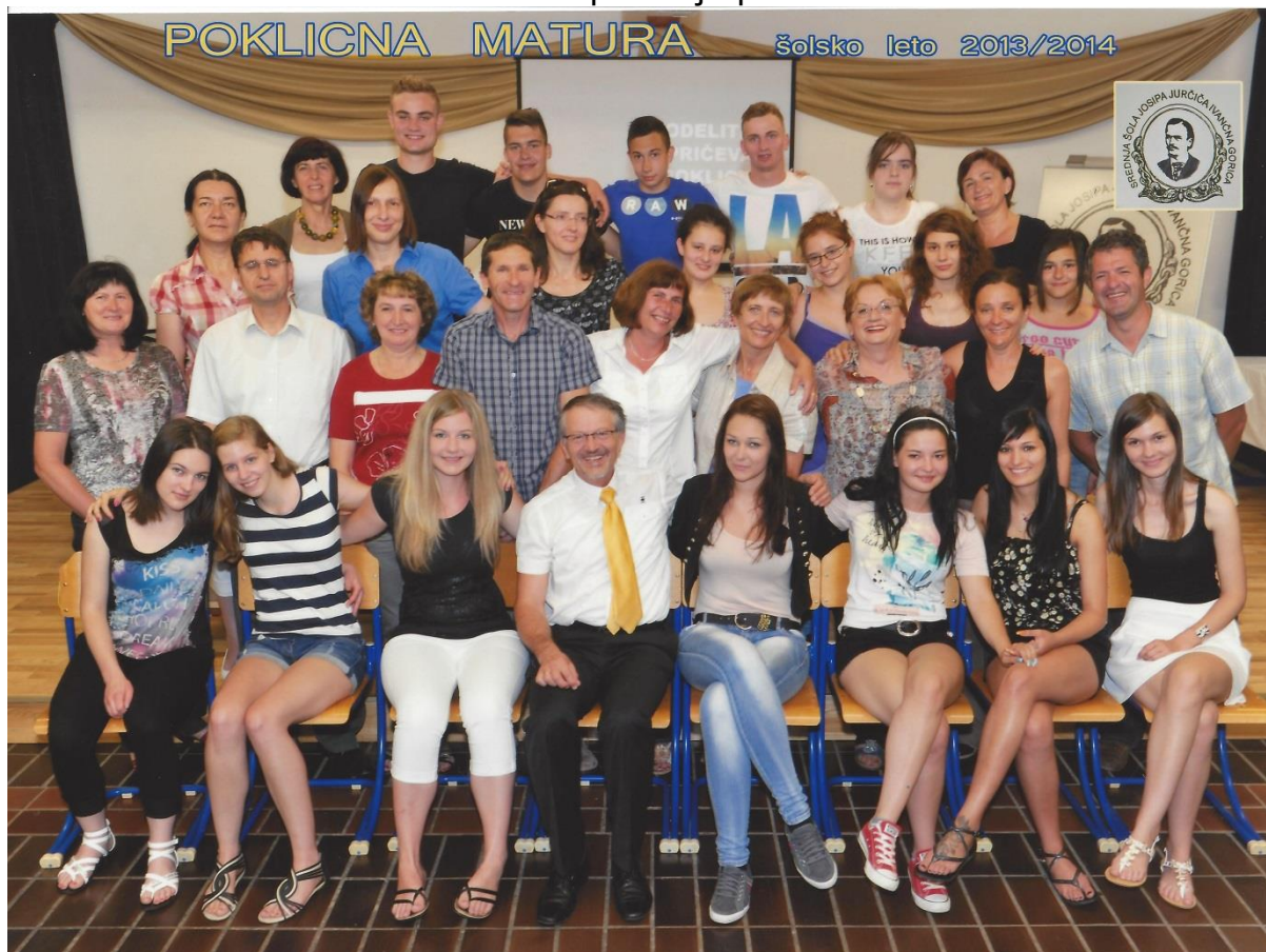
Slika 2: Pred podelitvijo spričeval PM