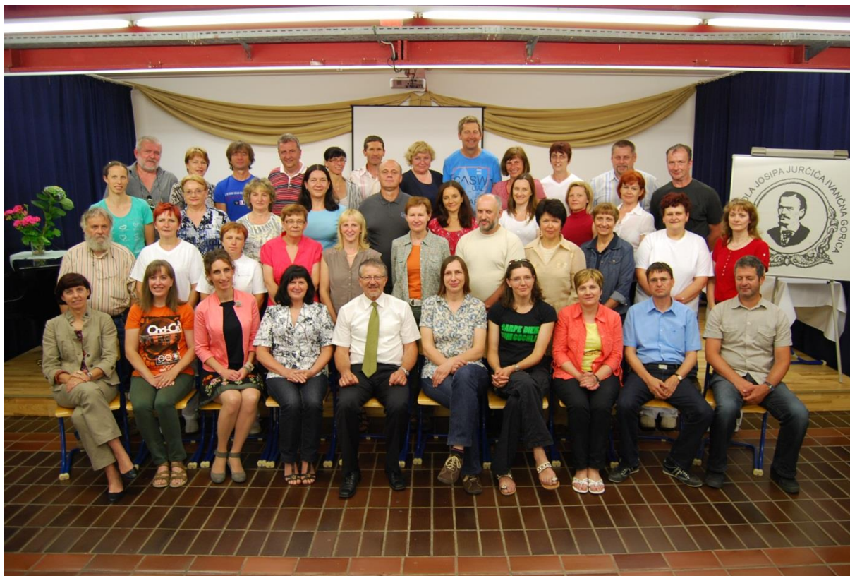
Slika 1: Kolektiv Srednje šole Josipa Jurčiča Ivančna Gorica ob koncu pouka 2013/2014

Svet šole, imenovan za mandatno obdobje 2013–2017, sestavljajo: