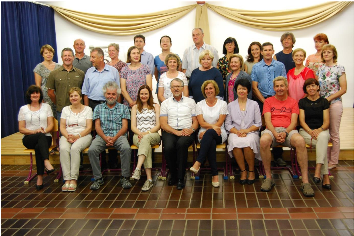
Slika 1: Kolektiv Srednje šole Josipa Jurčiča Ivančna Gorica ob koncu pouka 2016/2017