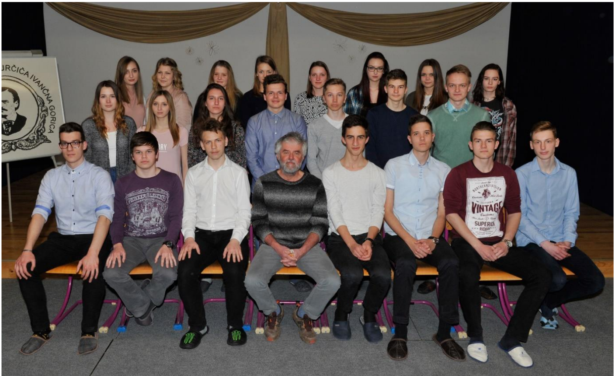
ŠOLSKO LETO 2016/17 2.B