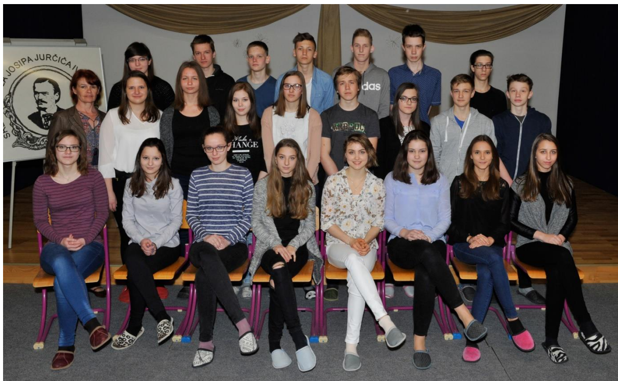
ŠOLSKO LETO 2016/17 1.B