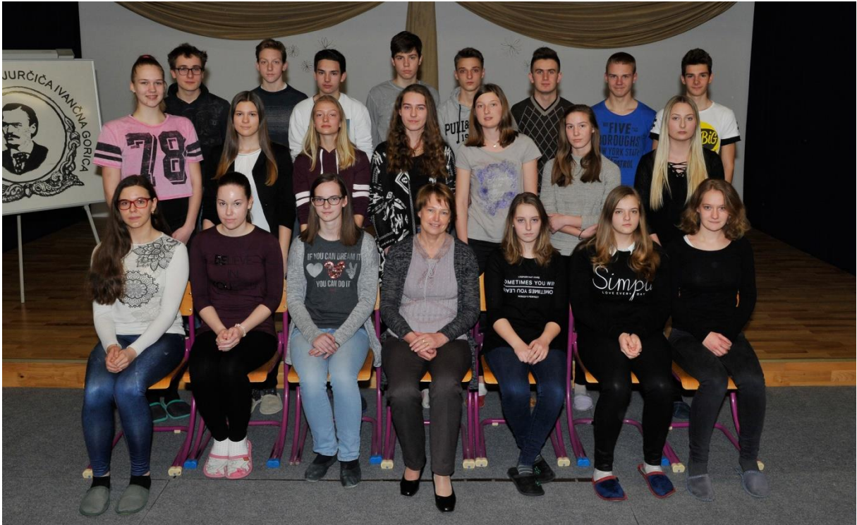
ŠOLSKO LETO 2016/17 1.A