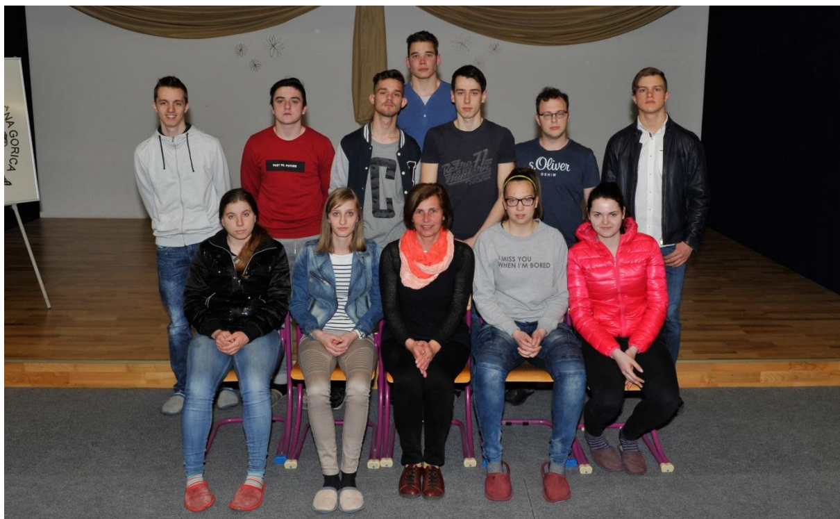
ŠOLSKO LETO 2016/17 4.D