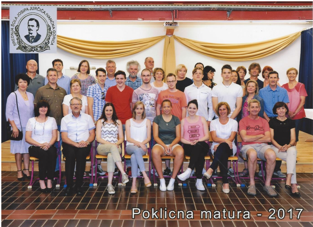
Slika 2: Pred podelitvijo spričeval PM

Poklicna matura v jesenskem roku je potekala od 24. avgusta do 2. septembra 2017. PM sta opravljali 2 kandidatki. Ena je opravljala popravni izpit, druga pa je izboljševala oceni. Uspeh na poklicni maturi v jesenskem roku je 100-odstoten, saj sta bili obe kandidatki uspešni.