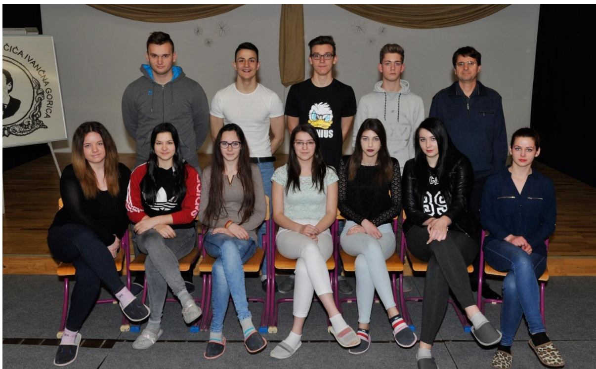
ŠOLSKO LETO 2016/17 3.D