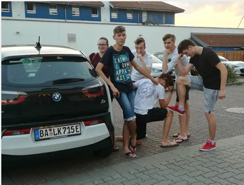
Pred hotelom Drive Inn

Čeprav smo opravljali tudi neekonomska dela, smo izredno hvaležni za možnost sodelovanja pri projektu Erasmus, ki nam je omogočil nabiranje izkušenj ter spoznavanje nemške kulture.